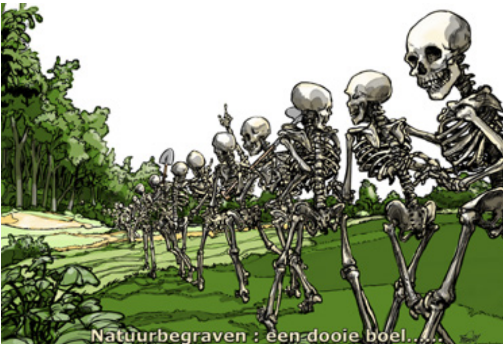
Tekening Frank Muntjewerf

Die eeuwigheid is op de natuurbegraafplaats niet verbonden aan een naam, een individu, een ego. Maakt dat de mens die voor de natuurbegraafplaats kiest tot een onbaatzuchtige weldoener en degene die kiest voor een graf met eeuwigdurend grafrecht op een gewone begraafplaats tot een egotripper? Zo simpel is het natuurlijk ook weer niet, want op oude graven en begraafplaatsen wordt ook over de historie van een stad of dorp en haar inwoners verteld. Maar het zet wel aan tot nadenken. Bij mij tenminste – wat zoek ik in een graf? En bij u hopelijk ook – wat denkt u dat de mensen bij u zoeken en wat wilt en kunt u hen bieden?